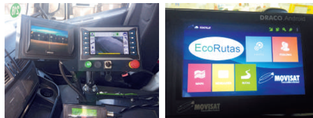
Sistema de procesamiento de información de los vehículos de Rivamadrid

recogido en cada zona. El sistema ya ha sido testado con éxito en los últimos meses.